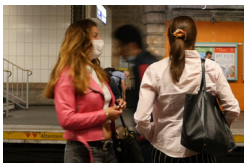
© Manon Marguerit et Félix Cardoso, extrait de l'affiche de la série Visibles, 2022.

Visibles est une série documentaire de 58 minutes réalisée par Manon Marguerit et Félix Cardoso en 2022. Durant trois épisodes, huit couples de lesbiennes évoquent les formes de violences qu'elles subissent dans les transports en commun franciliens et se confient sur les stratégies mises en place pour y faire face. Les participantes emmènent ensuite les réalisatrices avec elles sur un trajet. Dans le documentaire, les lesbiennes participantes mettent en scène leur relation dans un jeu de dévoilement et de dissimulation. Un des objectifs est de faire réagir les transporteurs, comme la RATP, engagés dans la lutte contre les violences sexuelles et sexistes.