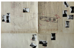
René Pechère, Dessin et photographies, Anney, Ile Saint-Joseph, 1959, CIVA

En quoi l'approche photographique des sites de projet construit-elle un voir professionnel spécifique ? Les pratiques et productions photographiques de trois paysagistes, constitutives de méthodes de travail dès la rencontre du terrain, seront questionnées comme procédés de montage d'espaces par l'image.