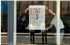
© Agence 360, Affiche de l'exposition Etat des lieux au 44 Gassendi, juin 2024

Une agence d'urbanisme, également lieu d'exposition de photographies, invite l'image à s'immiscer dans l'espace et à infuser les pratiques de projet. Comment une pratique visuelle s'impose dans la démarche de projet ?